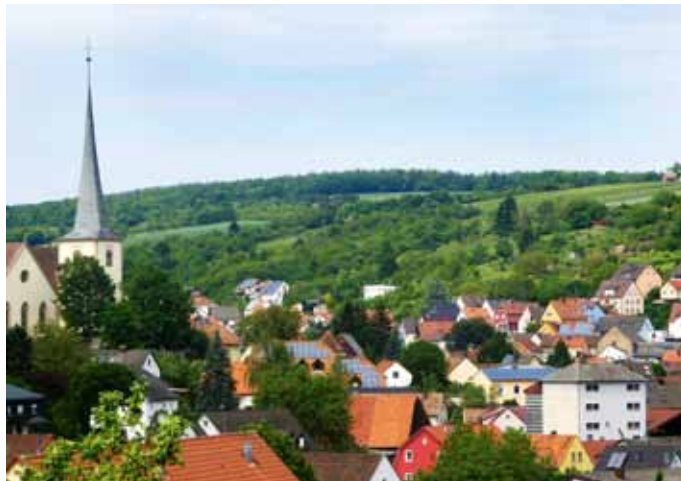
Die IGU machte in den 90er-Jahren Rimpar zur zwischenzeitlichen „Solarhochburg“