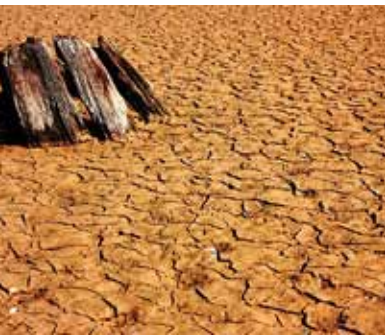
Ausgetrocknete Erde: Die Klimaveränderungen zerstören ganze Landstriche