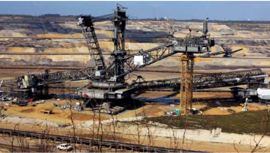
Braunkohle: Beim Abbau wird viel Natur zerstört. Und: Der CO 2 -Ausstoß beim Verbrennen der Kohle ist „Gift“ für das Klima