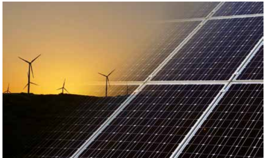
Unverzichtbar: Wind- und Sonnenenergie

Nur mit 100 Prozent Erneuerbaren Energien kann das Weltklima vor dem Kollaps bewahrt werden. Dazu ist (auch) der schnelle, gezielte Windenergieausbau – verteilt auf möglichst alle Regionen Deutschlands – unverzichtbar.